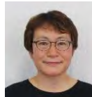
高柳和加え おいしいケーキの 12ヶ月