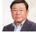
窪田英治 俳句入門・一步二歩 芭蕉を読む他